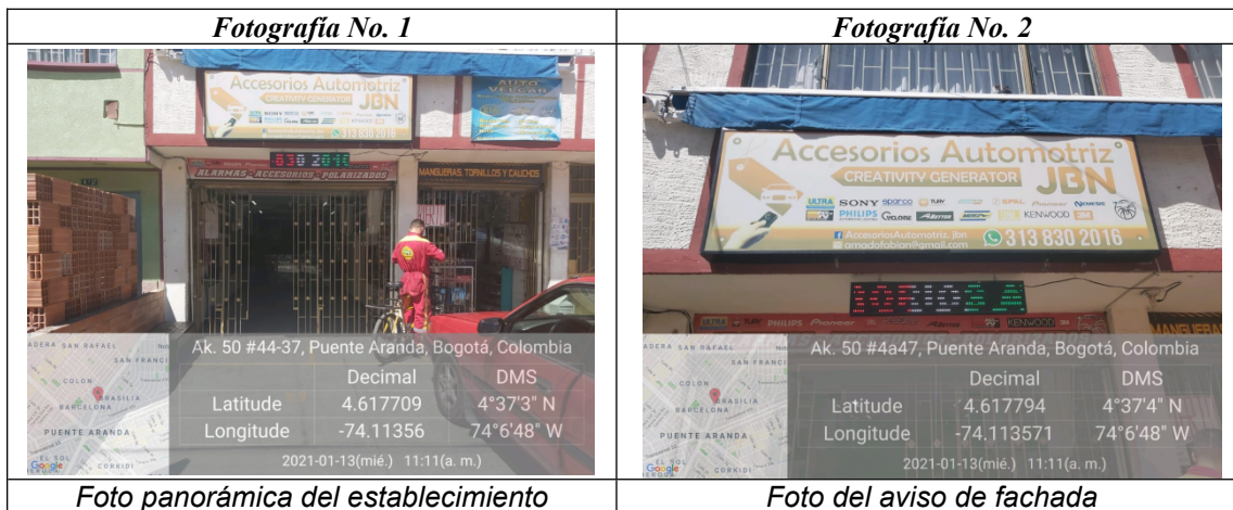
Foto panorámica del establecimiento